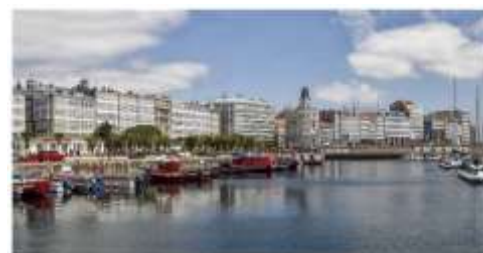
Galerías de La Marina A Coruña: ciudad de cristal

La oferta gastronómica que podemos encontrar en A Coruña es muy reconocida y variada; no deben dejar de probarse los mariscos y pescados de primera calidad aunque la carne no queda atrás en calidad y exquisitez. Las empanadas, quesos y vinos de la tierra son productos que no dejarán indiferente al visitante.