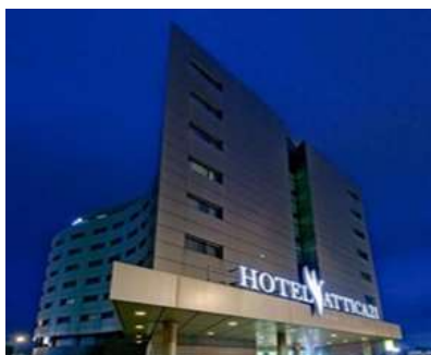
Hotel Attica 21

Dependiendo de sus preferencias usted puede alojarse en distintos hoteles de la ciudad de A Coruña siendo recomendables cualquiera de estas opciones: