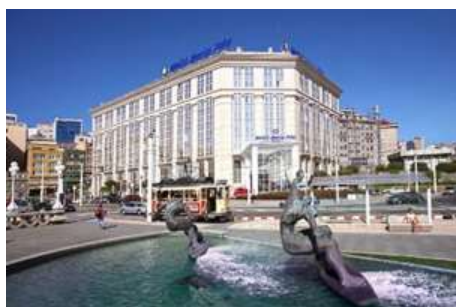
Hotel María Pita

Ofrece unas vistas espectaculares al mar. Se halla en el centro de A Coruña, a unos 500 metros de lugares de interés como la torre de Hércules y el Museo de Ciencia Domus.