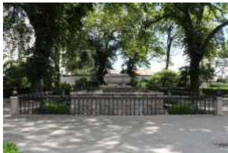
Jardines de San Carlos