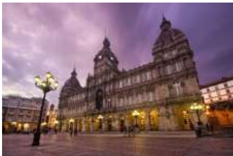
Plaza de María Pita

Un largo Paseo Marítimo rodea casi por completo la ciudad. Siéntese en una terraza en la Plaza de María Pita y descubra su apasionante historia. O pasee por los Cantones admirando sus famosas galerías de cristal , de estilo modernista. Además, tiene excelentes museos como el de Bellas Artes , la Casa de las Ciencias , la Domus o el Arqueológico , en el Castillo de San Antón . Y al atardecer, nada como el acogedor y romántico Jardín de San Carlos o la animación de los Jardines de Méndez Núñez , en pleno centro.